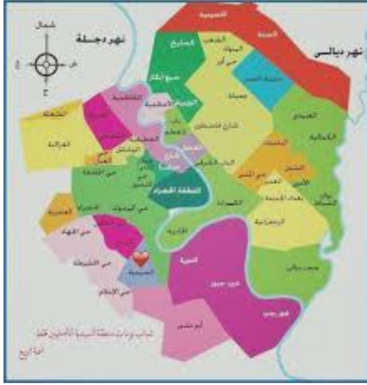
مدينة بغداد (١)

كما ذكر أيضاً بعض نساء بغداد شعراً فيها، فقالت: (٢)