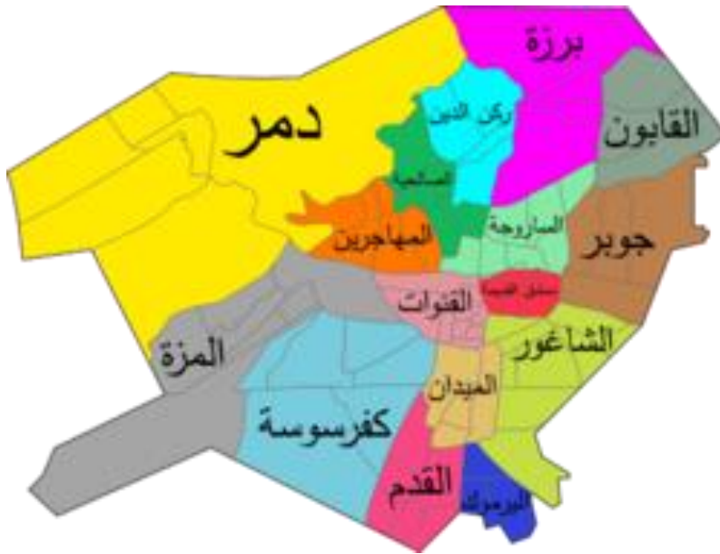
خريطة دمشق (١)

لقد اشتمل البيت الشعري السابق على استعارة تمثلت بتشبيه المغني الذي يغني على أوتار الآلات الموسيقية بالقمر الذي يظهر في كبد السماء، فذكر المشبه به، وحذف المشبه، وذلك على سبيل الاستعارة التصريحية، فقد صرح الشاعر بذكر ذلك المشبه، وقد أفاد من هذه الاستعارة بأن جعلها سبباً للمبالغة في إظهار ذلك الجمال العظيم الذي تتصف به دمشق، وما يرتبط به من تفاعل كل ما حولها بهذا الجمال العظيم.