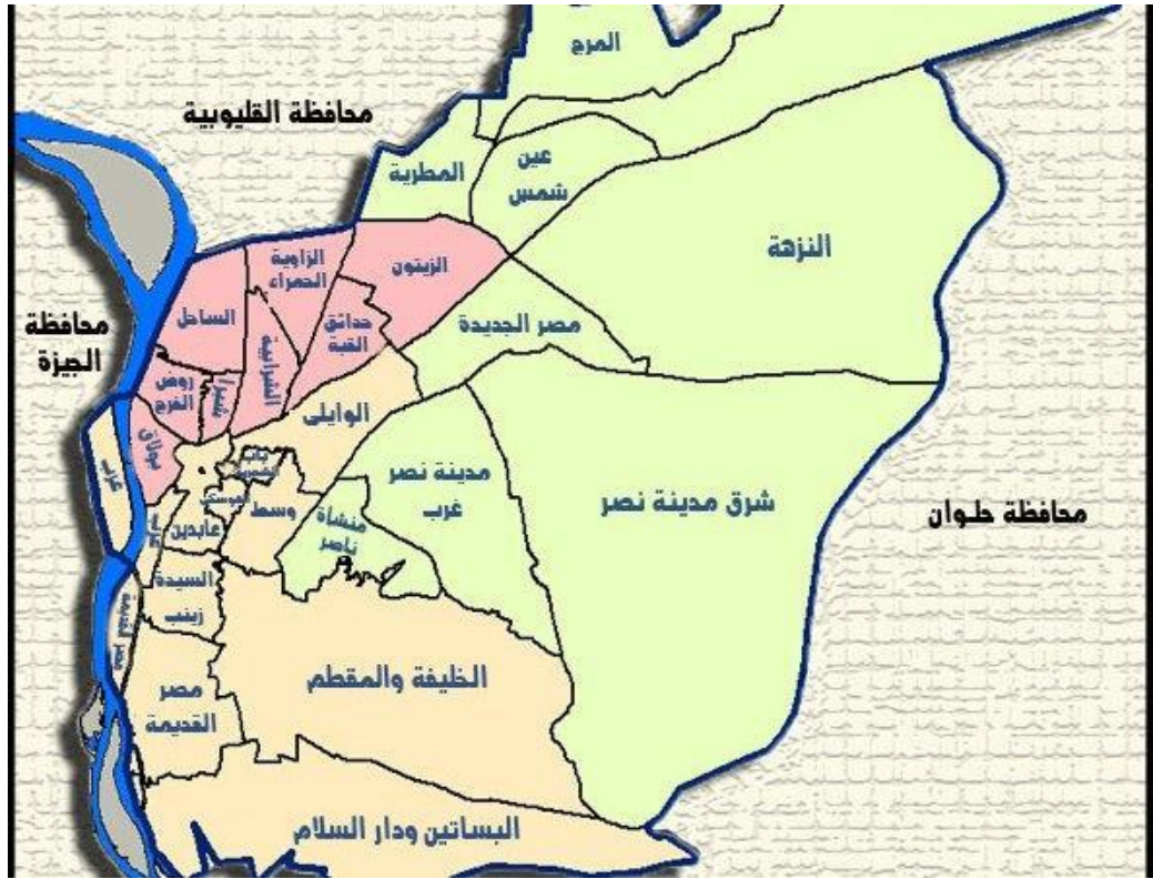
خريطة مدينة القاهرة (١)

اشتقاقياً يتكئ عليه في مكونات تلك الاستعارة، وذلك عبر اشتقاق ذلك الفعل "قهرت" ليلمح به إلى المتلقي باسم القاهرة ذاتها.