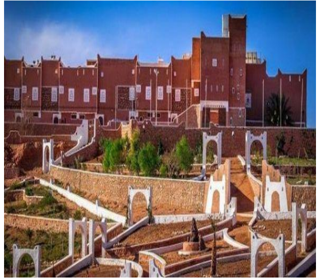
القصور من العمائر التراثية في المدن الصحراوية الجزائرية

أحجامها الكبيرة، وطرق الملح والذهب القديمة، وواحاتها التي شاهدت موجات اللاجئين إليها من بربر وزنوج ويهود ومسلمين، على مر القرون فيأتون إليها ويختفون فيها ثم يستوطنونها فيجعلون منها جنة على الأرض) (بوجدره، 2002، ص65).